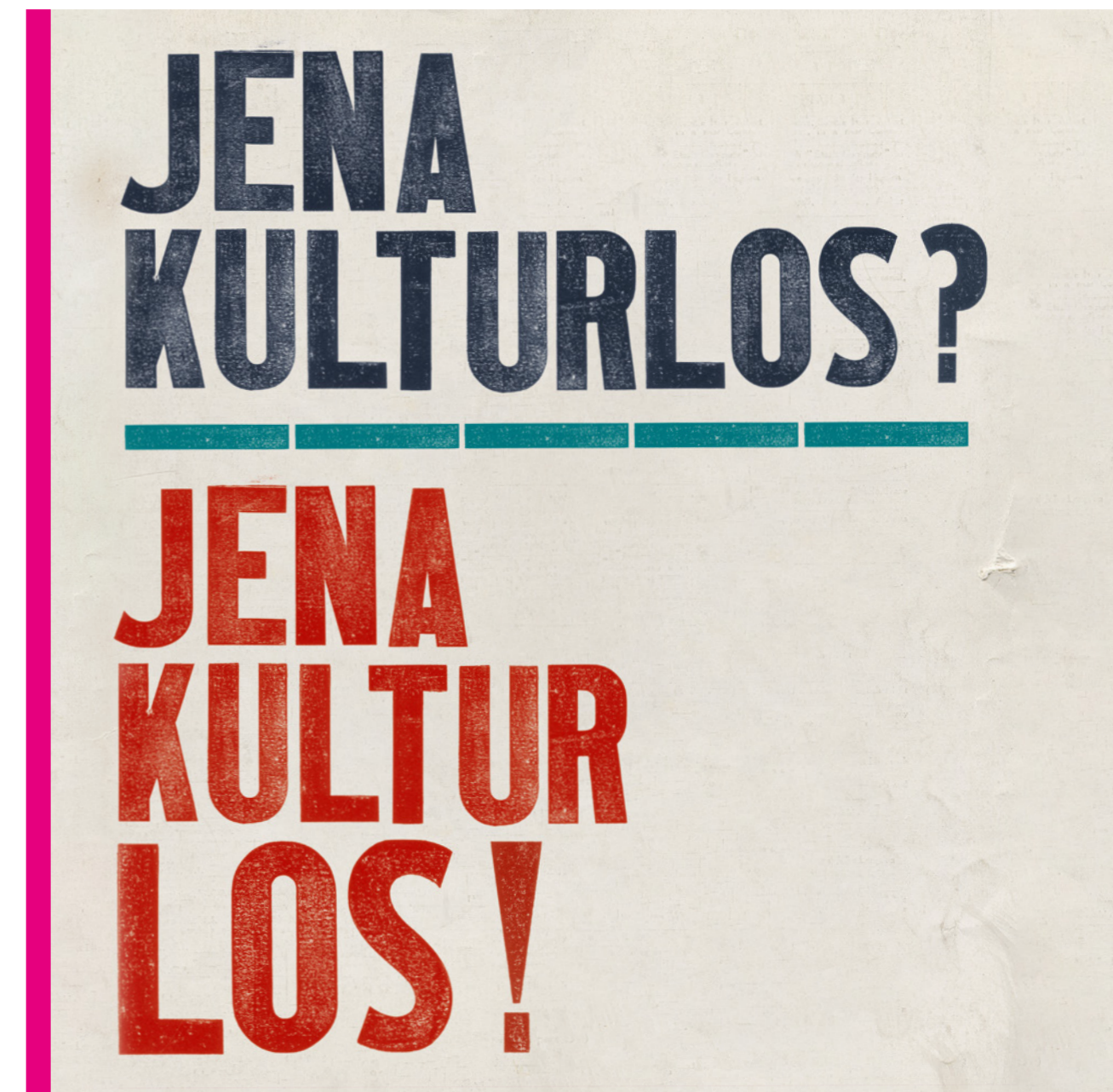
Gestaltungsbeispiel „Plakat“ im Kontext des partizipativen Prozesses zur Kulturkonzeption „2021-2025“

Im Folgenden werden nun die Projektorganisation und das Projektvorgehen, die Zielstellungen für die Fortschreibung, eine Rückschau auf die vorangegangenen Kulturkonzepte und die Ergebnisse der Bürgerbefragung detailliert vorgestellt. Darauf aufbauend folgen ein umfassender Katalog mit geplanten Maßnahmen bis zum Jahr 2025 sowie ein Ausblick auf den Zeitraum danach bis zum symbolischen Datum 2030.