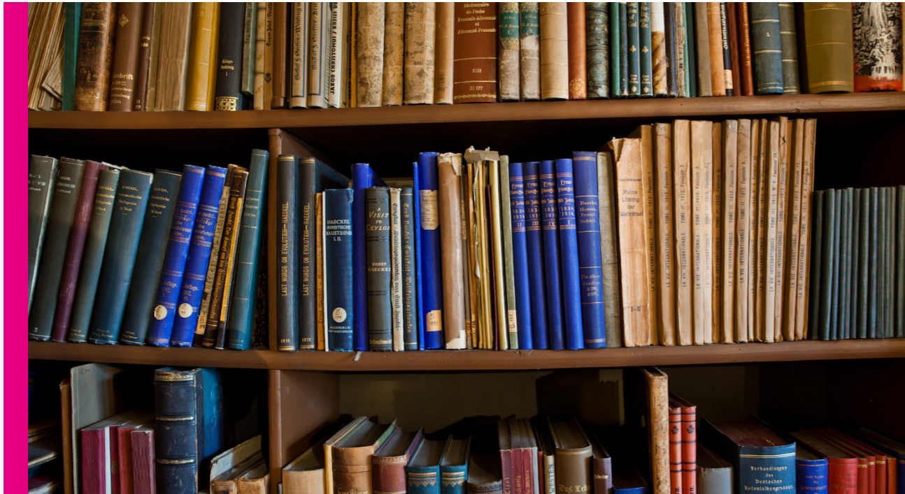
Arbeitszimmer Ernst Haeckels | © JenaKultur, Foto: Jens Hauspurg

Kunst, Kultur und Kulturelle Bildung müssen in einer Phase der Beschleunigung, Krise und Veränderung Hort und Anker der Entschleunigung und Fantasie, der Gegenentwürfe und Utopien sein. Darin bestünde eine wesentliche Erkenntnis dieser Zeit der Transformation. Gerade in einer Zukunftsstadt wie Jena gilt es, sich auf diesen Wesenskern des "Weniger ist mehr" beziehungsweise des "Was wir machen, machen wir richtig" zu besinnen. Beim „Weniger“ geht es nicht zuletzt um die Frage, was ist kulturelle Grundsicherung und wie kann sie erhalten werden, beim „Mehr“ stellen sich die Fragen der Auswahl und der Akzentuierung.