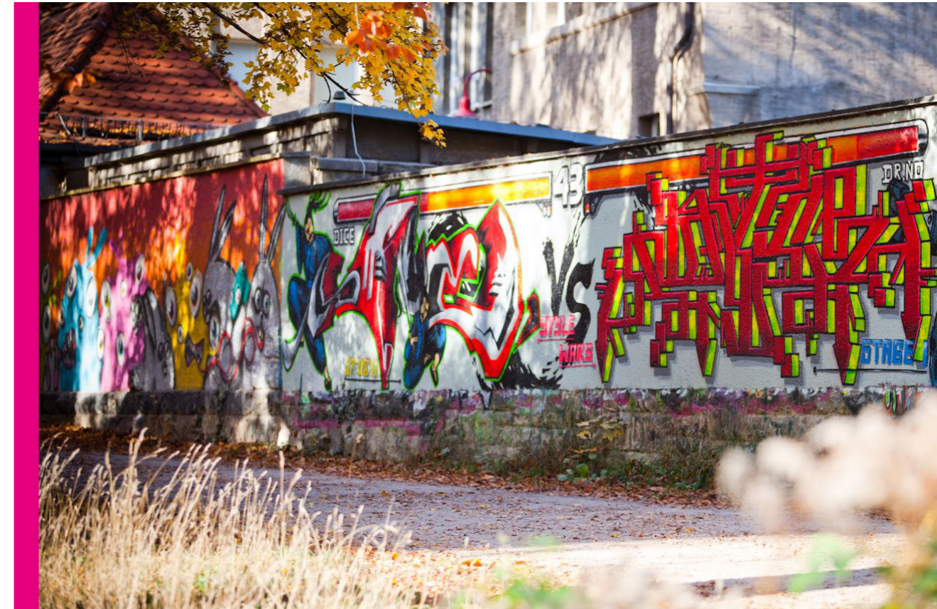
Graffiti-Kunst in Jena

Es entspricht der Überzeugung der Redaktionsgruppe und des die Kulturkonzeption in den Stadtrat einbringenden Kulturausschusses, dass die zeitliche Betrachtung von kurzfristig erforderlichem Krisenmanagement bei gleichzeitiger Definition der mittel- und langfristigen Entwicklungsaussichten der Kultur in Jena einem zukunftsweisenden Vorgehen entspricht. Die alles entscheidende Grundlage hierfür sind und bleiben eine ausreichende (a) auf dem Weg der Zuschussvereinbarung durch JenaKultur stabil abgesicherte und (b) wenigstens von der Werkleitung des Eigenbetriebs, wenn nicht sogar von einem Kulturdezernenten, umsichtig moderierte Finanzierungsperspektive. Nur, wenn jetzt der Mut besteht, die Leistungsfähigkeit der Jenaer Kultur kurzfristig zu sichern und mittelfristig zu sortieren, kann sie sich langfristig so aufstellen, wie es die fünf Ziele vorgeben und die drei Meta-Effekte erfordern. Entsprechend muss der Blick über den Tellerrand einer zyklischen Haushaltsplanung reichen. Nur mit einer starken Kultur und Kulturellen Bildung wird es Jena gelingen, sich als Stadt so vielversprechend weiterzuentwickeln, wie es vor den großen Krisen und Transformationen den Eindruck verbreitete.