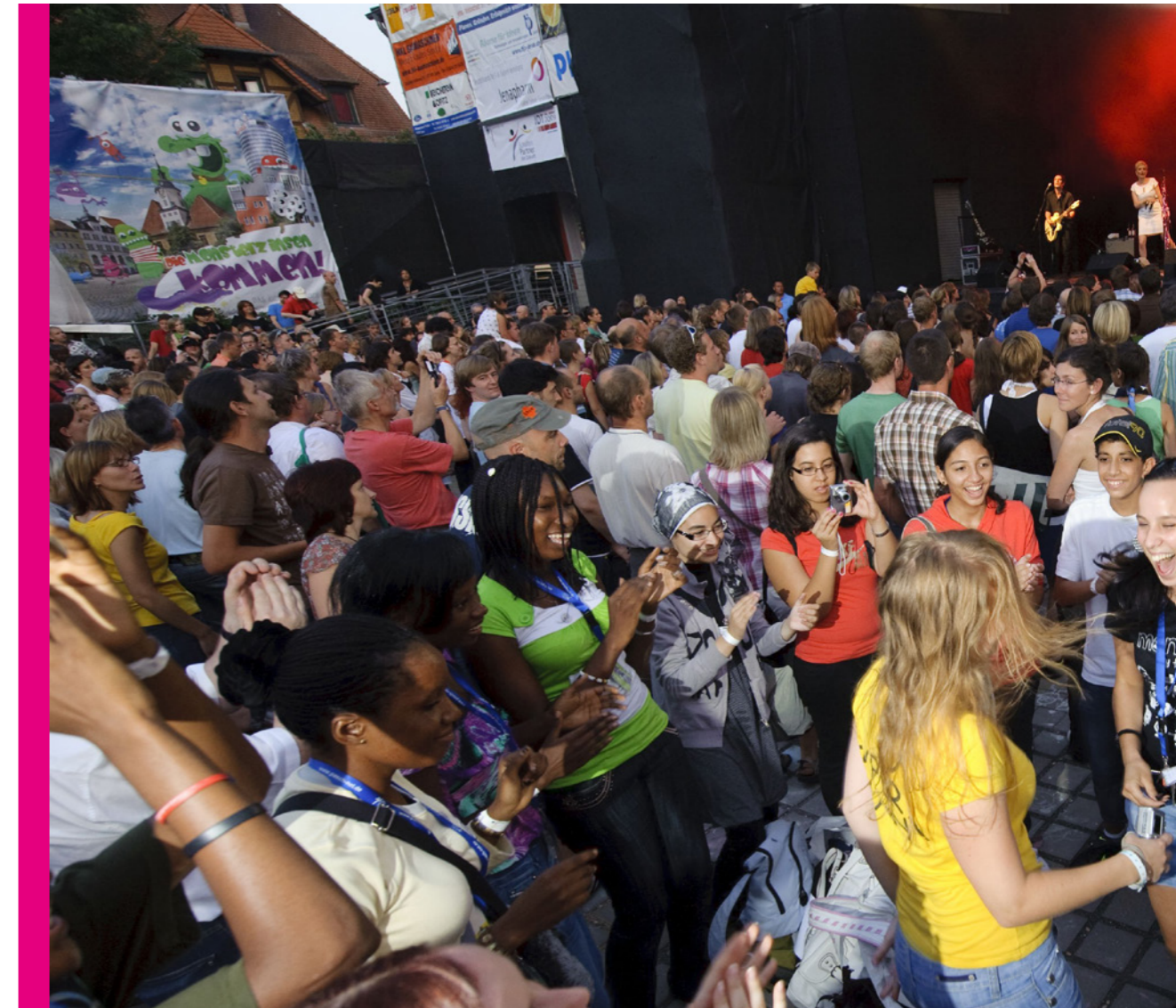
Kulturarena Jena

orte zu Fuß. Kultur ist für die Jenaer Bürger*innen zumeist ein soziales Ereignis. Etwa 90 % der Befragten gaben an, Veranstaltungen als gemeinsame Aktivität mit Freunden und Familie zu nutzen. Fast ebenso viele nannten Unterhaltung als den Hauptgrund für den Besuch eines kulturellen Angebots. Immerhin etwa ein Drittel der Befragten sucht in der Kultur auch nach inhaltlicher Herausforderung und der Auseinandersetzung mit dem Zeitgeschehen.