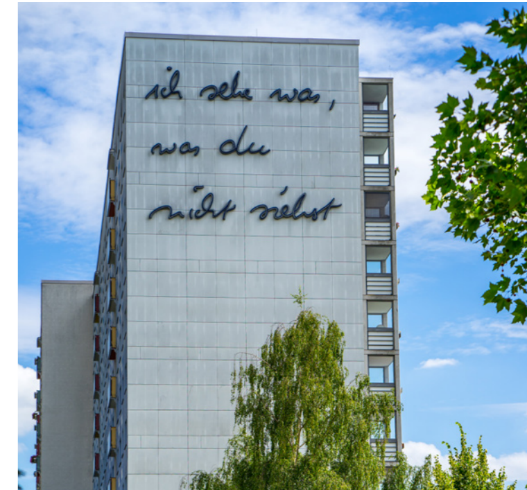
Häuserfassade in Jena-Lobeda

Die Stadt Jena hat im Jahr 2010 zur Weiterentwicklung ihrer Kulturlandschaft erstmals eine Kulturkonzeption erstellt und diese für die Jahre 2017 bis 2020 fortgeschrieben. Somit sollte in diesem Jahr die zweite Fortschreibung des Kulturkonzepts erfolgen, doch die Rahmenbedingungen waren dieses Mal ganz besondere. Die Corona-Pandemie beeinflusste den Entstehungsprozess und die Ausrichtung des Konzepts erheblich. Die Gegebenheiten haben viele Bereiche des öffentlichen Lebens vor bisher ungekannte Herausforderungen gestellt. Insbesondere der Kulturbereich, von der Landes- und Bundesregierung zunächst als nicht „systemrelevant“ eingestuft, wurde zeitweise nahezu auf Null heruntergefahren.