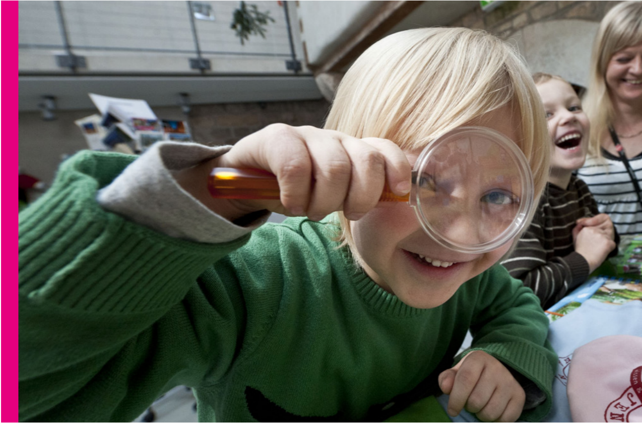
Kinder im Museum

Anders formuliert: Erfahren die Angebote mit der größten Förderung auch den meisten Zuspruch der Bürger*innen, beziehungsweise werden die meistgenutzten Angebote auch entsprechend gefördert? Selbstverständlich trägt diese Frage im Hinblick auf eine nachhaltige und vor allem innovative Entwicklung der Jenaer Kultur nur einen hinreichenden, keinen notwendigen Charakter. Zu deutlich hat die Redaktionsgruppe auch die Zuschusserfordernisse von Bereichen vor Augen, die ihrer Natur nach nicht massenwirksam sind, dennoch eine relevante Bedeutung tragen und damit politische Aufmerksamkeit verdienen. Man denke nur daran, wie beispielsweise die Wirtschaft oder Wissenschaft ohne Grundlagenforschung auskämen! Nichtsdestotrotz vertritt das vorliegende Papier die Auffassung, dass entsprechende Entscheidungen für Zuschüsse von Angeboten ohne breiten Zuspruch nach Möglichkeit umso bewusster getroffen werden sollten. In diesem Sinne möchte die Redaktionsgruppe die formulierte Prüffrage als kritischen Begleiter durch die nun folgenden Ableitungen verstanden wissen.