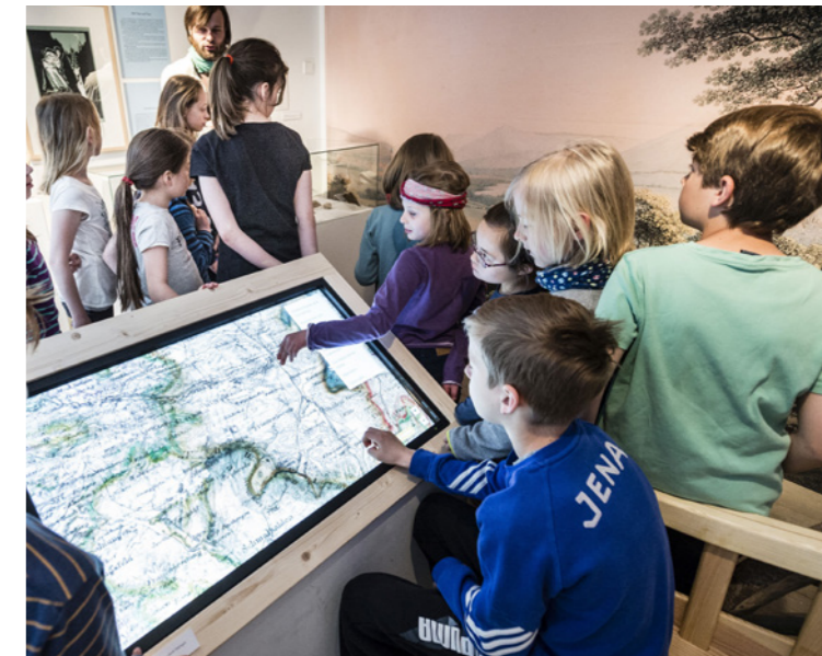
Kinder im Museum

Zu allen vom Eigenbetrieb JenaKultur verwalteten Einrichtungen und Spielstätten liegen Zahlen hinsichtlich Besucheraufkommen, Veranstaltungsentwicklung, Einnahmen und Ausgaben vor. Eine differenzierte Besucherstatistik, zum Beispiel nach Alters- und Einkommensstruktur, fehlt aber. Von den vielen Akteur*innen und Institutionen außerhalb von JenaKultur liegen keinerlei Zahlen zur Auswertung vor. Eine strukturierte, intern geführte Statistik würde den freien Kulturschaffenden nicht nur eine selbstständige und kontinuierliche Evaluation ihrer Angebote und Entwicklung ermöglichen. Zusätzlich bildet sie auch die Grundlage der Kommunikation mit städtischen Partnern und Geldgebern oder für umfassende Analysen der Jenaer Kulturlandschaft wie der aktuellen.