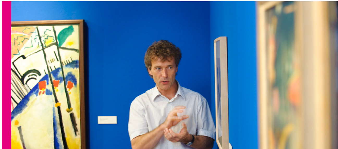
Kunstsammlung Jena

Aus diesem Grund machte sich die Redaktionsgruppe auch Gedanken darüber, ab welcher kritischen Größe ein einzelnes kulturelles Angebot überhaupt relevanter Gegenstand der Diskussion und Bewertung sein kann. Für die eigene Arbeit fand sie folgende Operationalisierung, die im Rahmen des vorliegenden Kulturkonzepts als Richtlinie auch für künftige Debatten und Entscheidungen der politischen Gremien innerhalb der avisierten Jahre bis einschließlich 2025 gelten soll: